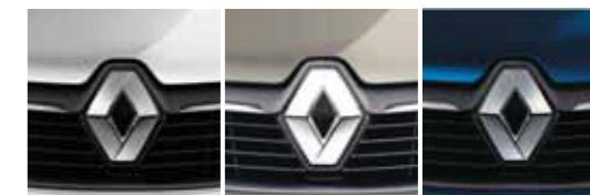
Gris Estrella Beige Ceniza Azul Persa